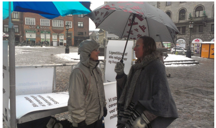
Gadeaktion i Hovedstaden

om foreningen og vores aktiviteter samt uddele humoristiske julekort. Det gav god kontakt til mange mennesker. Vores hovedstadsafdeling har også afholdt fester ved vinter- og sommersolhverv, og dermed illustreret, at det ikke kun er naturligt at højtideligholde de store overgange i livet, men også at højtideligholde overgangene i året og naturen.