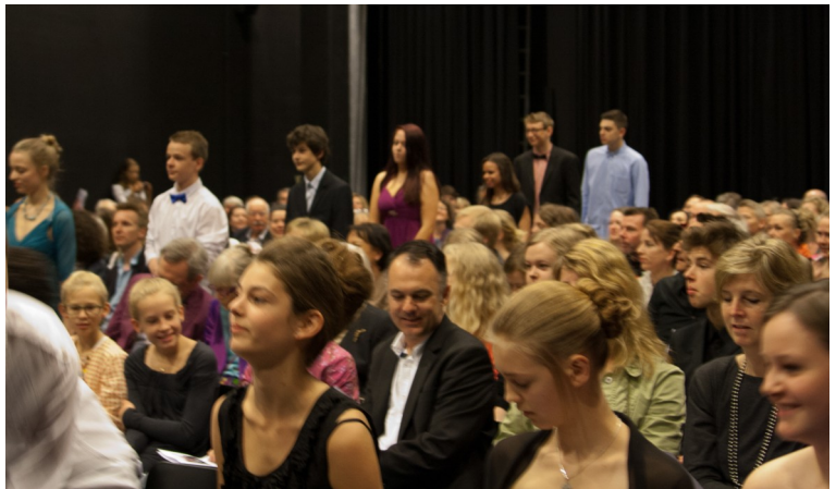
Fra årets konfirmation

som ikke direkte relaterer sig til lovforslag L 106 (om ligestilling af homoseksuelle og heteroseksuelle). Spørgsmålet om udvidelse af retten til at fore-