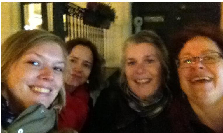
Fire kursister i Oslo til konfirmationskursus

Sidst i januar har 4 nye personer aflagt eksamen som ceremonileder for begravelser. Vi havde inviteret alle medlemmer til at overvære deres ka-