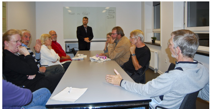
Filosofisk café i Viborg

Foreningens arbejdsprogram for 2011 – 2015 angiver, at "Så snart det er økonomisk muligt, skal der etableres et fysisk sekretariat". Det er på nuværende tidspunkt ikke økonomisk muligt, men hovedbestyrelsen har gjort sig nogle overvejelser om, hvordan vi kan skaffe de nødvendige indtægter. En inspirationskilde har været Café Retro i København. Det er en café hovedsageligt drevet af frivillige. En café kan give indtægter og samtidig kan der ved caféen indrettes mødelokaler og andre sekretariatsfunktioner. På landsmødet præsenterer vi disse tanker som et oplæg til debat.