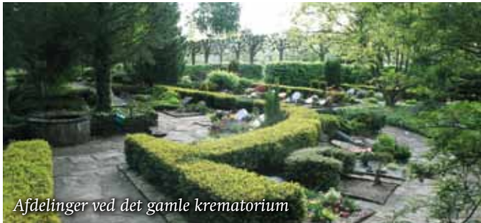
Afdelinger ved det gamle krematorium

Her findes også en nyere afdeling med urnegravsteder i stauderbunddække samt en lille afdeling ved det gamle krematorium med mindeplader på væggen over en fælles urnegrav.