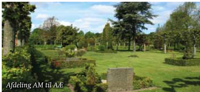
Afdeling AM til AÆ

Her ligger en katolsk afdeling med et smukt krucifiks. Centralt i området langs hovedvejen gennem kirkegården ved Heden ligger et ca. 300 m 2 stort staudebed. Det er et smukt syn i store dele af året med den varierende blomstring, hvor farver og former skifter og blander sig med hinanden.