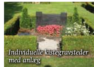
Individuelle kistegravsteder med anlæg