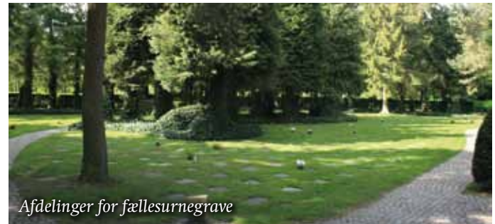
Afdelinger for fællesurnegrave