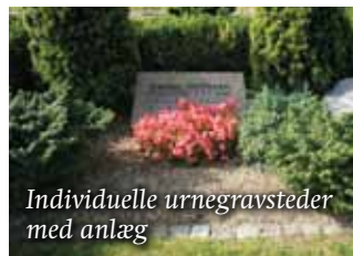
Individuelle urnegravsteder med anlæg