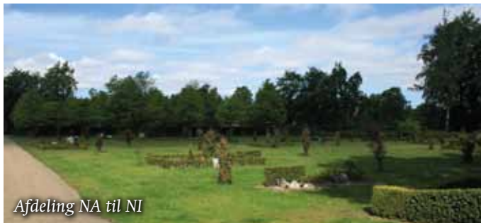
Afdeling NA til NI

De få individuelle kistegravsteder ligger spredte på græsset i et system, der med tiden bliver mere og mere uigenkendeligt, efterhånden som gravstederne hjemfalder.