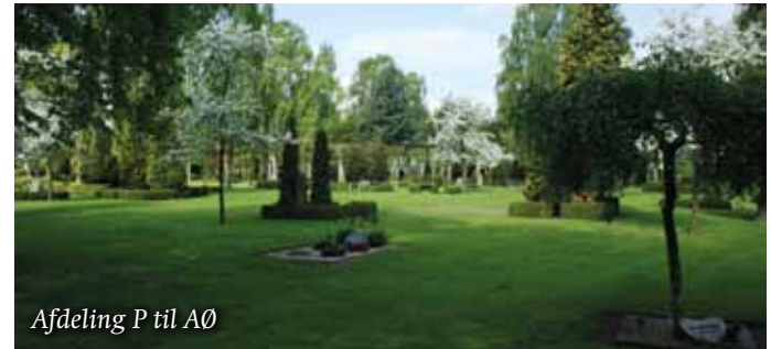
Afdeling P til AØ