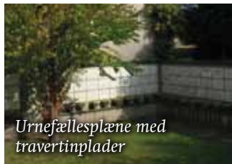
Urnefællesplæne med travertinplader

Man kan anlægge gravstedet, som man ønsker, og man må gerne pynte med gran.