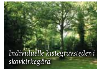
Individuelle kistegravsteder i skovkirkegård

Man kan anlægge gravstedet, som man ønsker, og man må gerne pynte gravstedet med gran.