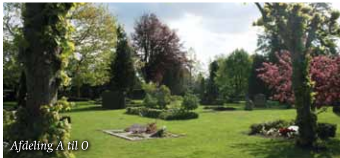
Afdeling A til O

Her er der overvejende individuelle kistegravsteder, men man kan også finde individuelle urnegravsteder i området, da det ofte er et ønske at blive begravet eller nedsat på denne ældste del af kirkegården mod byen.