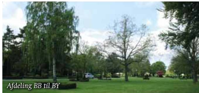
Afdeling BB til BY