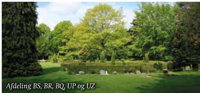
Afdeling BS, BR, BQ, UP og UZ

Fællesnævneren er, at de ligger tæt på Kirkegårdskapellet, og de danner ramme og rum om vejen fra Kirkegårdskapellet ud på kirkegården under de store ahorntræer. Stedet har en særlig stemning med de store træer, der strækker deres grene og løv ud over vejen og ind over afdelingerne.