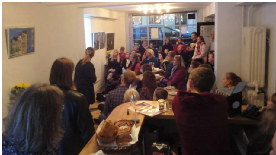
Informationsaften i Kafé Mensch

Desuden var der plads til, at en tidligere HS-konfirmand sagde et par ord om sin oplevelse, og det var faktisk rørende at høre hende berette om, hvordan