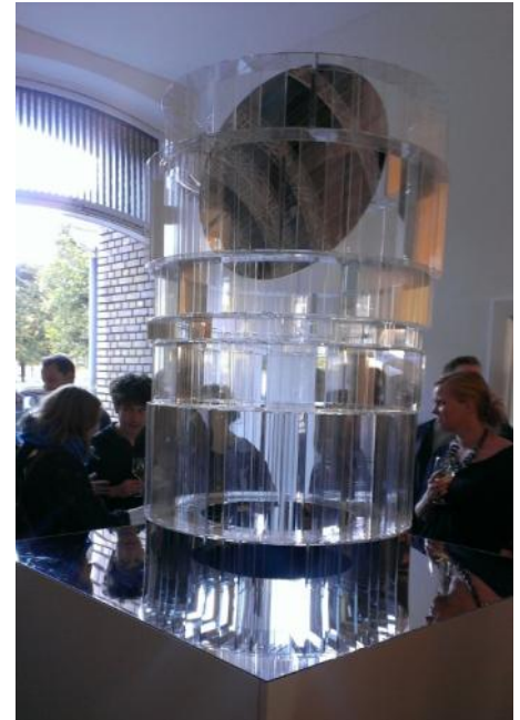
Svendborg Architects model af et CeremoniRum

Den værdighed der ligger i, at samfundet anerkender dets borgers forskelligheder nok til at skabe et CeremoniRum, er det fundament som det skal bygges på. Højtideligheden over de rammer som bygges er de søjler, som bygningen hviler på og som gør det særlig egnet til ceremonier. Der er taget de specielle hensyn, som ceremonielle rum skal tage, nemlig at der stemmes til eftertanke og højtid, og at sorg og glæde kan rummes uforstyrret. Neutraliteten i rammerne er