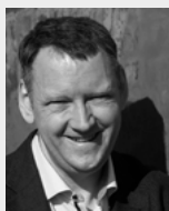
AF OLE WOLF TALSPERSON

Det mærkelige er, at den opfattelse bliver dementeret af virkeligheden hver eneste jul. Endeløse er de bekymringer, som man gør sig ved udsigten til at skulle være sammen med ens søsters uopdragne børn, ligesom tanken om at skulle tilbringe tid med ens 60-årige fars nye kæreste kan fjerne enhver følelse af familiefølelse og julefred.